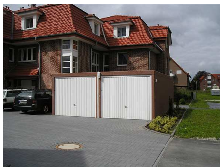
Dvojaráž v provedení s přidavným čelním osvětlením