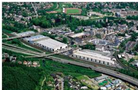
sídlo společnosti v Kreuztalu, Süd-Westfalen

Společnost Siebau Raumsysteme GmbH & Co. KG se sídlem v německém Kreuztalu v Süd-Westfalen patří mezi renomované evropské výrobce montovaných ocelových staveb: garáží, garážových stání, zahradních domků, halových systémů a také širokého sortimentu v oblasti skladovací a speciální skladovací techniky. Již více než půl století zkušeností, vývoje, modernizace a podnikání v této oblasti řadí výrobky Siebau mezi špičkové evropské produkty se známkou vysoké kvality, odborného zpracování a certifikované výroby.