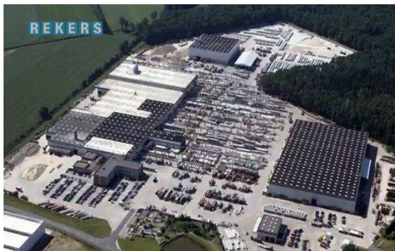
Jeden z výrobních závodů REKERS

Společnost REKERS se sídlem v německém Spellu je přední evropský výrobce betonových prefabrikovaných garáží. Se svojí produkcí několika tisíc ks ročně patří mezi lídry v této oblasti. Společnost se kromě svoji specializace na garážová řešení zabývá také výrobou mostních pilířů, komponentů pro velké stavby jako jsou stadiony, dálnice a další velké projekty.